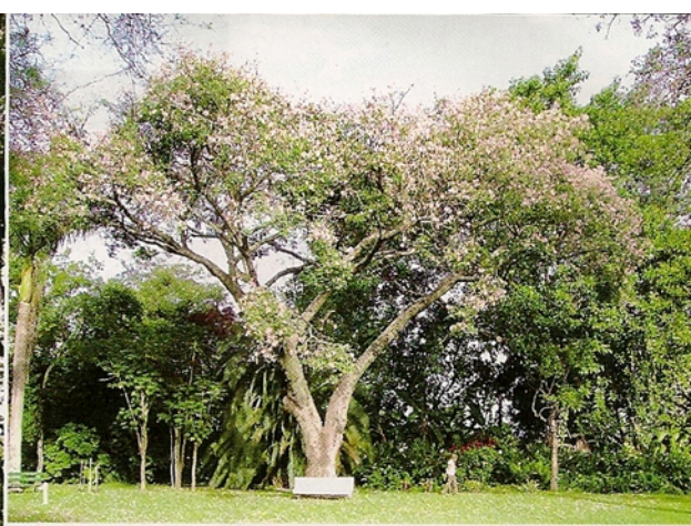
1- Palo borracho en flor. 2- Tulipán negro (kigelia pinnata). 3- Macadamia.