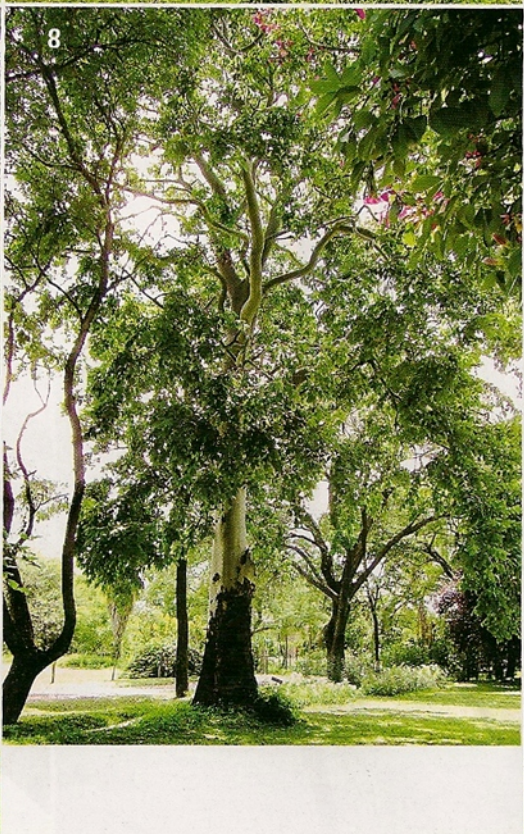
7- Gomero disciplinado (Ficus elástica aurea). En el centro de la foto se ve un triplaris americana de tronco liso y gris cuya madera se usa para hacer canoas. 8- Eucalyptus toreliana: árbol de tronco liso y verde. 9- Kiri (Paulownia tomentosa) flores lilas como candelabros.