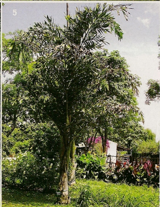
4- Ceibo amasisa de Bolivia 5- Palmera angelito (Caryota mitis). 6- Tulipán africano de flores rojas.